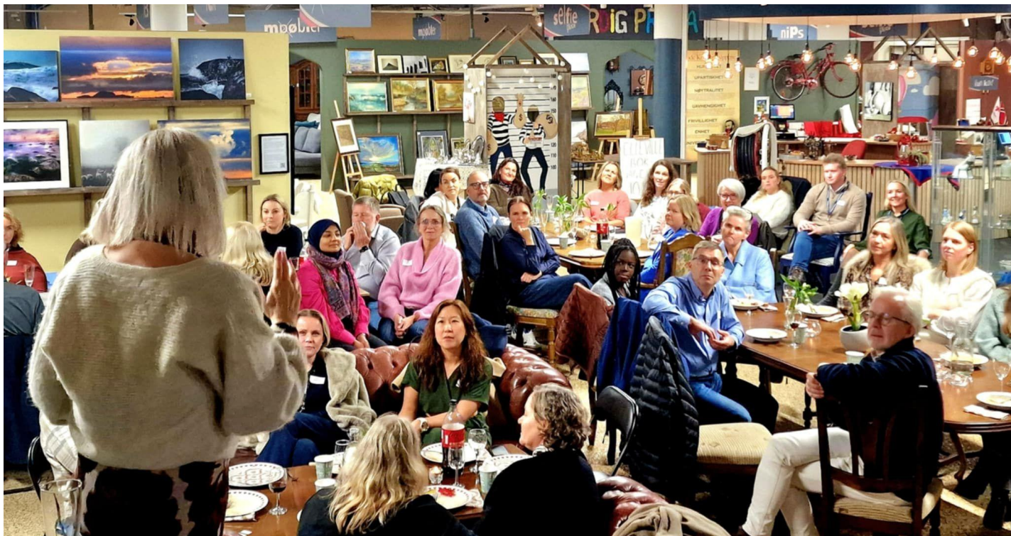
Foto: Fra konsulentsamling hos Røverkjøp Gjenbruksbutikk, Røde Kors Stavanger, 11. november 2025

Prosperastiftelsens formål er å ta sosialt ansvar gjennom å donere gratis kompetanse til sosiale entreprenører og ideelle organisasjoner som ellers ikke ville hatt tilgang til slike tjenester.